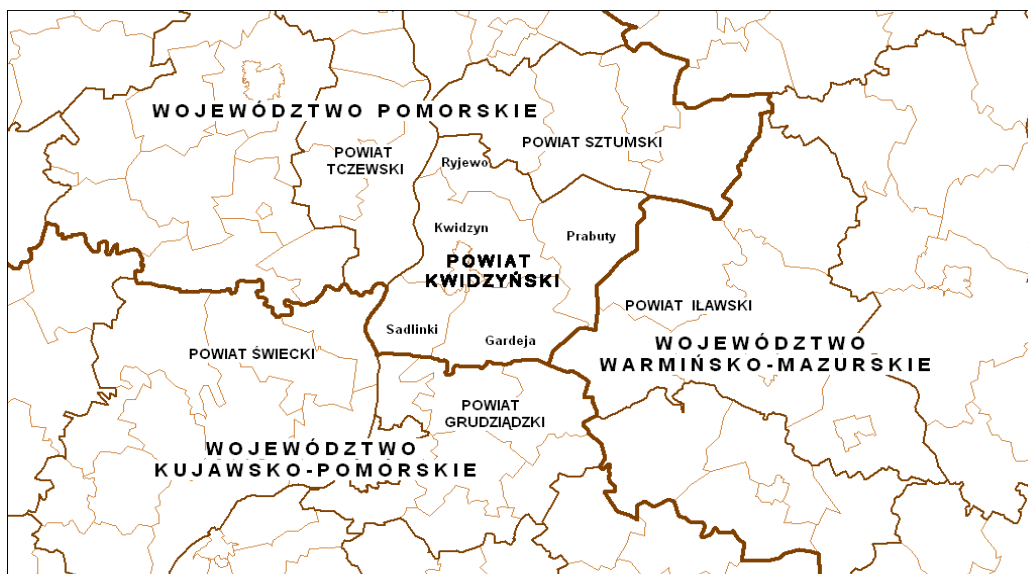
RYSUNEK 1. POŁOŻENIE ADMINISTRACYJNE BADANEGO OBSZARU